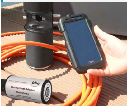
Kit bluetooth con smartphone para visualizar y manejar datos